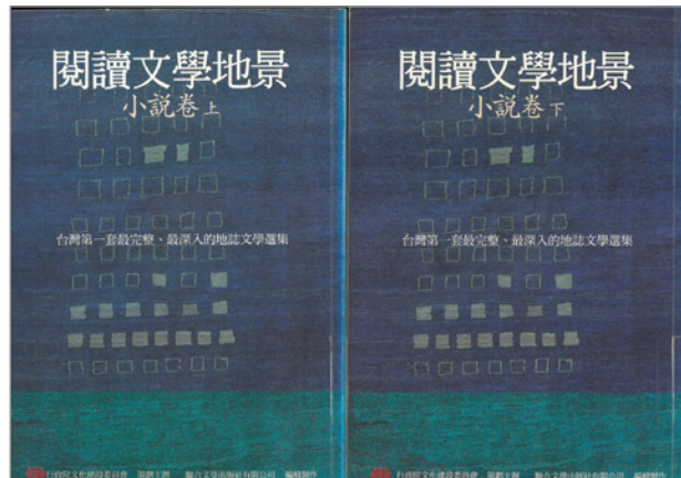
圖2.《閱讀文學地景》小說上、下卷

許多都是作家們的經典作品，包含記錄 50 年前臺北二二八公園的白先勇《孽子》、描寫臺中村婦之宿命人生的廖輝英《油麻菜籽》、描寫蘭陽濁水溪小村落生活的黃春明〈青番公的故事〉、描述蘭嶼各個部落族人的相互關懷情誼的夏曼·藍波安〈飛魚季：Arayo〉等。當時的文建會主委龍應台曾表示：「全世界每個不朽的地名，背後都連結著情感、記憶與故事，有成千上萬的人文想像。」民眾透過文學作品中所敘寫的情感與故事，可回顧先人在臺灣土地生活的變遷軌跡與人文風情，這套文集內容相當豐富，可說是臺灣最完整的一部地誌書寫選集 6 。