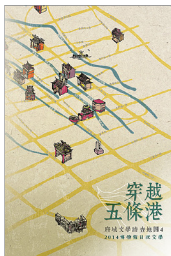
圖 6.「穿越五條港」府城文學地圖手冊

自 2011 年起至 2016 年，臺文館開始以系統性方式，每年推出一條以臺南府城為主之文學踏查路線，將踏查視為一種文學閱讀方式。以作家作品中的景點為本，透過字裡行間的指引，走讀作家的生命史及探索作家的生活日常。例如 2011 年「府城瑣憶文學踏查」以葉石濤文學作品中書寫有關臺南 61 個文學景點，從位於中西區的臺文館（原臺南州廳）為輻射起點，延伸至城市內其他 61 個文學地景，踏查時提供民眾作品摘句對照，加深文與景之關聯（圖 3）；之後接續完成之文學踏查為 2012 年「踏尋小封神：許丙丁的府城文學地圖」，內容以許丙丁先生所著《小封神》之府城廟宇為基點，在府城市街地圖上標示各廟宇位置，感受作者豐富的想