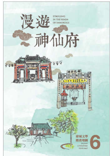
圖 8.「漫遊神仙府」府城文學地圖手冊