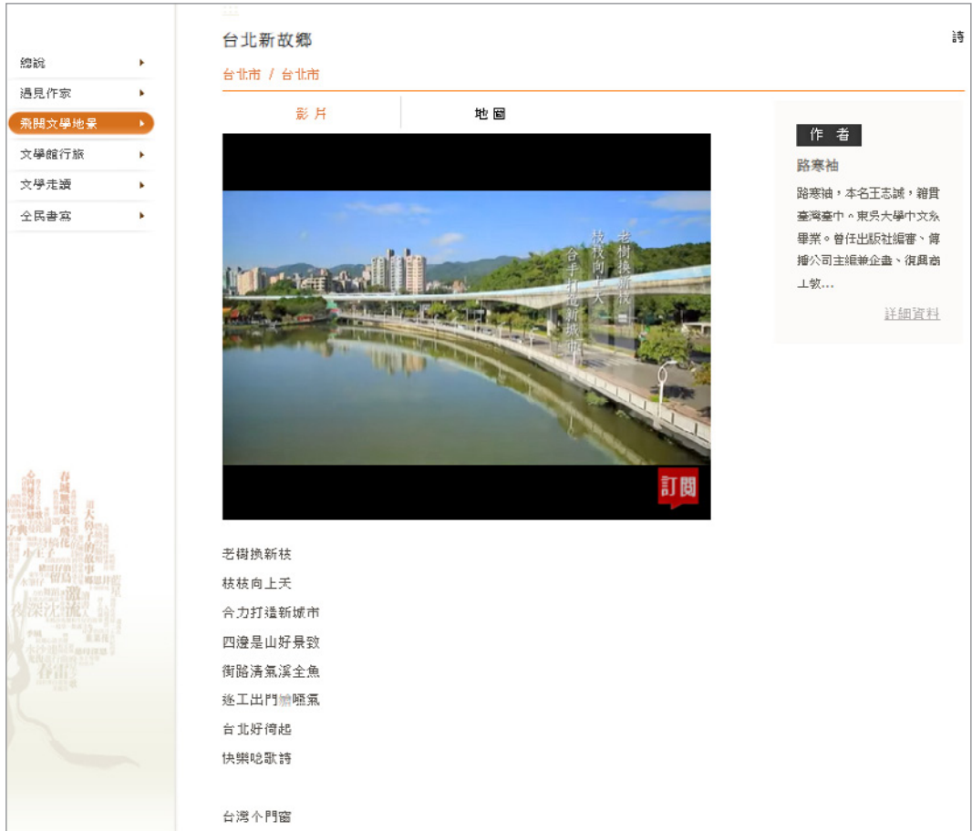
圖 14. 作家路寒袖〈臺北新故鄉〉作品，以文本、地圖、影像線上呈現。

文館出版之《遇見文學美麗島》一書中介紹收錄之 25 座文學主題博物館／作家故居，例如：臺灣第一座成立的平民文學作家紀念館「鍾理和紀念館」；1985 年臺北市政府為紀念林語堂，在其故居成立的紀念圖書館。這些館舍有的是作家生前生長或居住的房舍，有的是典藏作家珍貴文物手稿的主題博物館，探訪踏查這些館舍是認識作家最好的途徑。此單元內容有專人撰文之館舍介紹、照片、館舍開放資訊等(圖 15)。