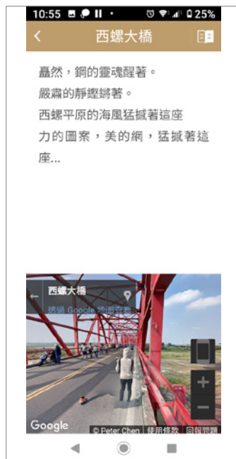
圖 21. Google 地圖衛星街景功能顯示地景位置影像