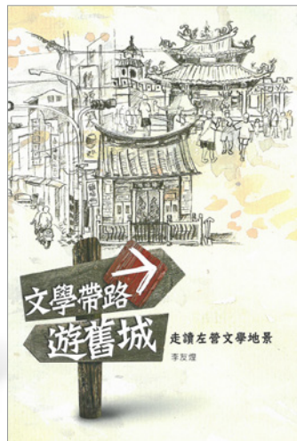
圖 10.《文學帶路遊舊城：走讀左營文學地景》圖書封面