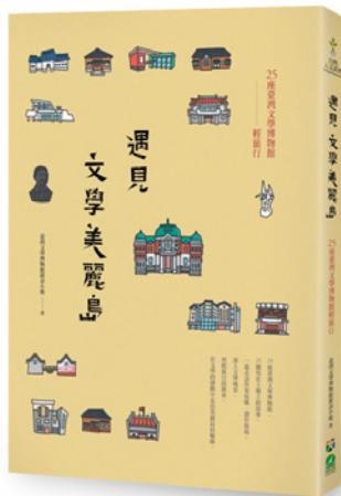
圖 9.《遇見文學美麗島：25 座臺灣文學博物館輕旅行》圖書封面