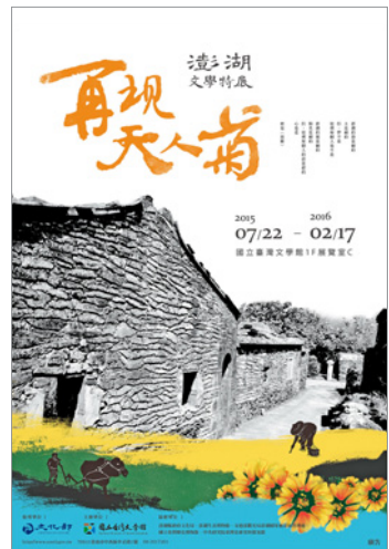
圖 11.「再現天人菊：澎湖文學特展」海報

赤崁樓出發，配合所選詩作，逐一走訪與飲食生產與消費的相關地景（圖 7）；2016 年「漫遊神仙府」踏查，選出 10 首與府城寺廟史蹟、信仰相關的古典詩作，從為人熟知的五妃廟為起點，從文本與實際景點對照，民眾可知今昔廟宇及信仰的變化（圖 8）（覃子君，2017：42-44）。臺文館使用之文本包含散文、小說、民間文學、