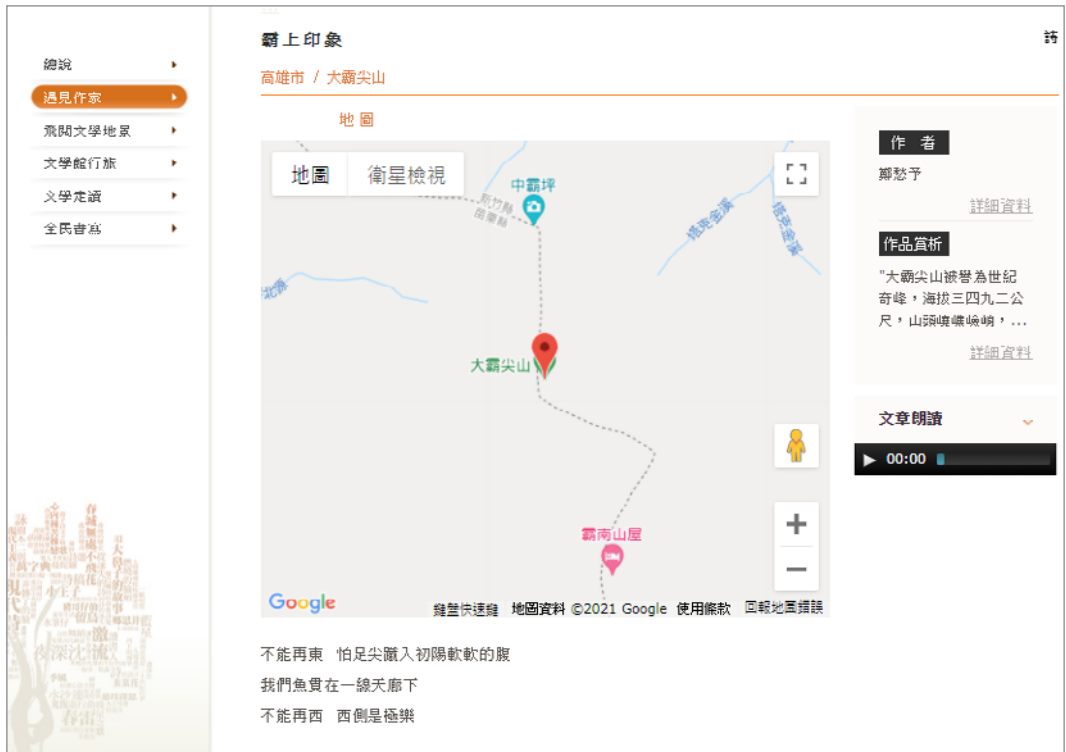
圖 13. 作家鄭愁予〈壩上印象〉作品，以文本、地圖、文章朗讀線上呈現。

部、民視、館外單位及臺文館推動執行的文學地景成果，以線上方式呈現，建置供民眾閱讀成果及創作的平臺 13 ，茲將「文學地景」專區所含單元說明如下：