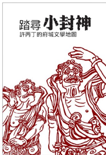
圖 4.「踏尋小封神」許丙丁的府城文學地圖手冊