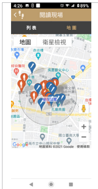
圖 20. 在臺文館現場使用手機版「閱讀現場」單元，顯示周遭 500 公尺內作品。