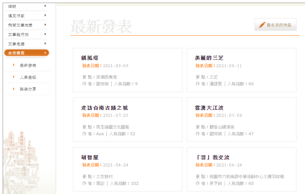
圖 17. 民眾最新發表的作品清單畫面

詩作；「再現天人菊：澎湖文學踏查」有 18 個景點及古典詩作；及由高雄文學館舉辦的「文學帶路·遊舊城：走讀左營文學地景」有 10 條路線及作品。踏查活動雖已結束，民眾還是可至此區瀏覽相關資訊，複製走訪路線。