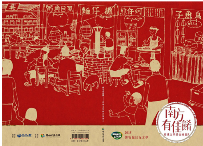
圖 7.「南方有佳餚」府城文學地圖手冊