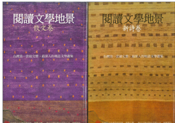
圖 1.《閱讀文學地景》散文、新詩卷

文建會（文化部前身）為提倡以文學閱讀臺灣，自 2007 年起，舉辦「閱讀文學地景」活動，委請專家學者編選最能代表家鄉特色的文學作品，內容以反映鄉土關懷、在地自然環境地理與具特色生活圈為優先。歷時一年多的評選、編輯，撰寫評介導讀，於 2008 年結集為《閱讀文學地景》文集，收錄從日治時期到近現代的作家作品，分為新詩、散文和小說（上、下冊）（圖 1、2），共收錄 259 篇作品，