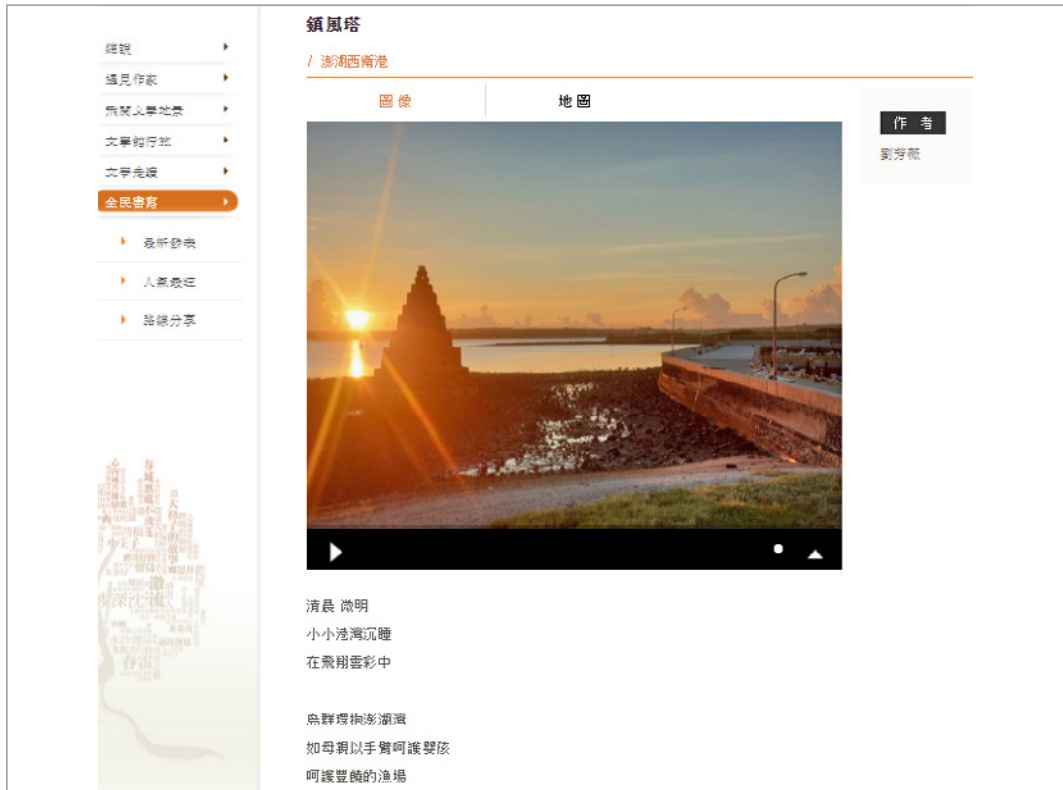
圖 18. 民眾書寫澎湖西衛港及圖照在線上呈現

功能，讓民眾在實際移動的同時，APP 程式可計算民眾所在位置，及對應的作品座標，即時同步顯示現場所在位置 500 公尺內之相關景點作品，及作品在地圖上分布的位置。圖 20 為在「臺文館」景點位置使用「閱讀現場」功能，顯示 500 公尺內之文學地景作品之手機畫面，其中褐色部分為「遇見作家」單元的作家作品，藍色部分為民眾上傳之作品，民眾可依其所在位置，閱讀周遭地景作品。其中如有知名作家之作品，民眾可一邊閱讀，一邊欣賞影片內之地景樣貌，與眼前實際所見之地景結合對應。民眾如是舊地重遊，在「閱讀現場」單元能閱讀到自己之前到訪此地所寫之作品，且與知名作家作品顯示在同一畫面，供民眾閱讀，感受一定非常特別。另外民眾在進行實地周遭景點探訪前，可使用 Google 地圖衛星街景及導航