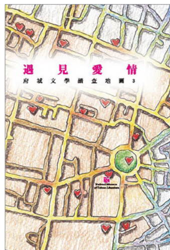
圖 5.「遇見愛情」府城文學踏查地圖手冊

府單位、各縣市政府、文學紀念館舍、學校等大力推動文學地景閱讀與書寫之際，臺文館也將「文學地景」視為重要展示主題，積極規劃多元的展示內容與活動，推廣臺灣地景文學，以下為臺文館推動的相關展覽與活動說明：