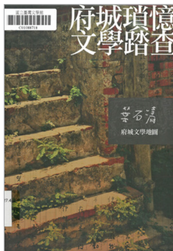
圖 3.「府城瑣憶文學踏查」手冊