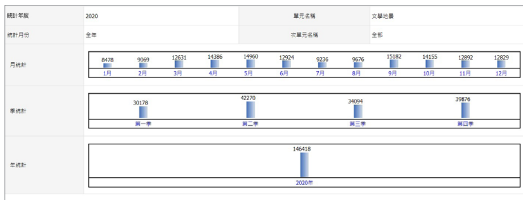
圖 22. 文學地景單元，2020 年每月瀏覽人次。

以 2020 年 146,418 人次造訪「全民書寫」單元來看，此平臺有幾個特性，才能維持每月約 12,000 人次瀏覽(圖 22)，例如：(一) 便利性：民眾下載手機版 APP 後，就像帶著一本文學旅遊電子書，可隨時隨地進行閱讀，或在景點現場，循著文學走讀路線，探訪周遭景點，進行豐富文