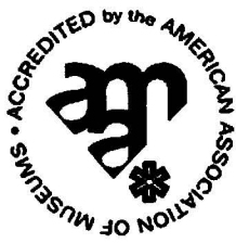
圖1.AAM審核合格的標誌

查、評審委員的實地評鑑、認證審核委員會的最終評估。此專案的評鑑水準以一九七〇年代美國博物館協會所修定的博物館定義為主(Burcaw, 1997)；其目的除鑑定博物館的現行行政管理、藏品管理保存及科教活動等是否合於現行專業水準之外，並提供其未來發展的建議。