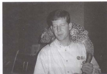
圖7. 福渥斯動物園義工在年會中晚間餐會中展示其園內的非洲刺蝟。(圖/宛涓攝)

斯(Fort Worth, TX)舉行，會議主題是「博物館的途徑」(Gateways)，共有四十多個專題討論，有近700名與會人士參與(圖6、7)。除此之外，協會也舉辦不同的研習會，由協會本身或其下的各小組協調，分區舉行。