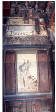
圖3 林宅一角