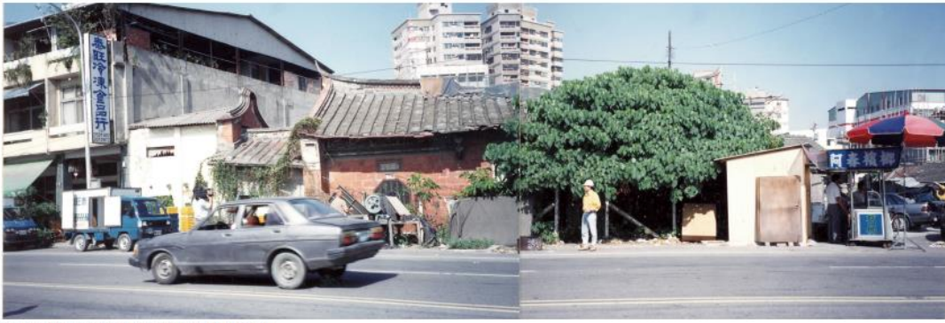
圖1 民國82年林家大宅第拆除之前