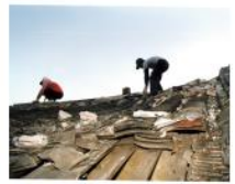
圖2 林宅拆遷照