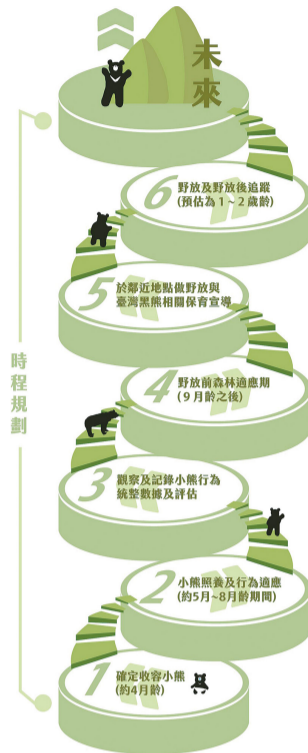
圖1 南安小熊的訓練野放規劃期程

2019年4月底，野放日的清晨，空勤總隊直升機將裝著Buni的鐵籠從臺中野訓場運到花蓮山