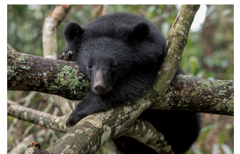
圖2 在訓練基地的南安小熊