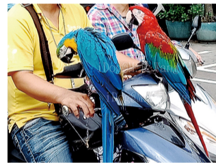
圖4 乘機車兜風的鸚鵡

邊是「費希氏情侶鸚鵡」，前者是澳洲特有的鳳頭鸚鵡，體長約30至35公分，喜歡啼叫；後者是非洲東岸坦尚尼亞及維多利亞湖附近草原的鸚鵡，體長約14至15公分，活潑好動，是最小型的牡丹鸚鵡之一。