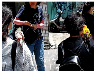
圖2 搭人肩上過馬路的鸚鵡