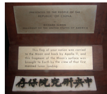
圖4 木製的臺座下方有兩塊金屬牌，我們戲稱為「原廠保證書」。上面那塊的文字是「敬獻給中華民國人民，美利堅合眾國總統一理查·尼克森贈」。下面那一塊是「這一面貴國的國旗曾經由阿波羅11號攜帶前往月球再回來，這件月球表面的碎片是由第一次載人登月的組員帶回地球的」。底下的白色壓克力牌「中央研究院保存」記錄了這件標本輾轉流傳的歷史。