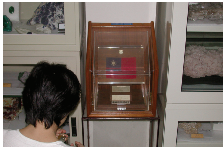
圖2 放置在科博館地質收藏庫中的月岩標本，經過多年輾轉流傳，目前已經是科博館重要的永久館藏。

而根據他們的了解，這一件標本是在1969年阿波羅11號任務完成後，經由NASA的月岩標本實