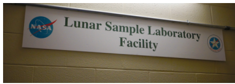
圖1 月球標本實驗室門口的招牌就是這樣簡單的一塊牌子

話說阿波羅11號的太空人踩上了月球表面之後，為了精準控制起飛時的重量符合原先的計算，於是把一些相機、尿袋、鞋套當作垃圾丟在月球