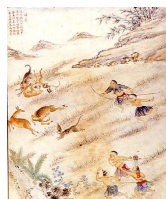
圖7 臺番圖說族人捕鹿圖