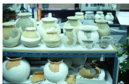
圖2 遺址出土陶罐復原