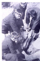
圖4 西拉雅族祀壺祭

番仔園文化年代距今1600至400年以前，分布範圍在大肚臺地西側緩坡、臺中盆地，八卦臺地，北至苗栗縣南部海岸丘陵，包括苑裡、番仔園、清水、中社、鹿寮、南勢坑、惠來遺址，當時流行俯身葬與北部十三行文化屈肢葬明顯不同。目前山仔腳遺址與苑裡、番仔園、山腳、南勢坑、惠來都有鐵器、琉璃珠及瑪瑙珠的出土，推測島內或島外貿易行為對番仔園文化晚期影響很大。有趣的是山仔腳鐵刀是向十三行還是向菲律賓人或漢人買的？又是否大肚番王可能向十三行人學得技術，命令從眾在八卦、大肚臺地找到含鐵團塊，鍛造更多利器以取得更多鹿皮貿易呢？未來值得進一步探討。