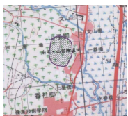
圖1 山仔腳遺址位於臺中南屯