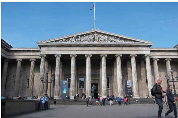
圖1 大英博物館正門

大中庭改建計畫的核心主軸即是以「人」為本，以服務設計(service design)為藍圖的概念進行再設計。博物館希望將花園重新再找回來，並創造一個新的空間，提供觀眾所需的各項服務設施，包括：1.個人及家庭語音導覽服務：提供英語、韓語、德語、義大利語、西班牙語、日語、法語、俄語、阿拉伯語、中文……等10國語言的個人導覽，另有家庭導覽服務，並於服務臺旁提供平板讓觀眾自行使用及查詢。2.導覽手冊：出版多國語言導覽手