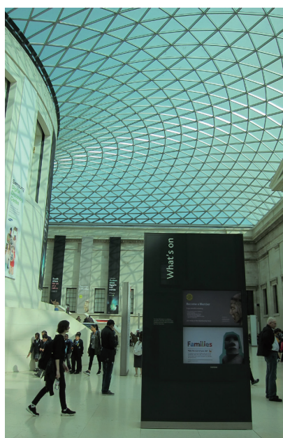
圖4 What's on多媒體宣傳資訊看板

冊及地圖供購買。3.What's on資訊看板(圖4)：以多媒體方式宣傳當期的展示及教育推廣活動，避免到處張貼海報而造成的視覺混亂。4.諮詢及購票服務臺：供觀眾諮詢各式各樣的參觀問題、特展售票、加入博物館之友等服務。5.博物館商店：依觀眾參觀路線設置規模不一的商店，販售由該路線上的精華展品所設計而成的文創商品，包括各式低、中、高不同價位的商品選項、優質的出版品以及高品質的複製品等(圖5)。最值得一提的是「餐飲服務」，在靠近大中庭東北側的Court Café空間提供了輕食餐飲，包括各式三明治、水果、麵包、甜點、咖啡、冷熱飲……等豐富而多樣的食物，成為人群聚集的熱點之一。另外西北側則提供長條型桌椅供觀眾休憩及食用自帶餐點的區域，這頗為貼心的設計讓觀眾除了能解決生理需求外，也提供了相互交流的空間。沿著圖書館弧形外牆的階梯蜿蜒而上來到Great Court餐廳，精緻的午餐及下午茶餐飲服務，不失為體驗世界級博物館服務的另一個好選項。大英的餐飲服務方案，提供親民價格及優質氛圍等級的多樣餐飲服務，供不同客群選擇(圖6)。