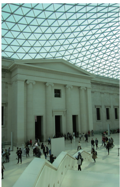
圖3 在軸心光線的引導下，觀眾得以自由穿梭於各展廳。