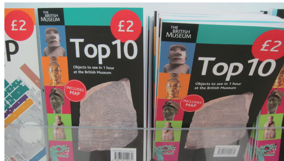
圖9 TOP 10手冊創造了10位明星級的商品

大英博物館藉由大中庭改建計畫重新定義公共空間，以有形(手冊、紀念品、餐飲……)的服務為接觸點，創造無形(文化、藝術、歷史、科技)的體驗，重新畫出服務設計藍圖，找回觀眾服務的價值。