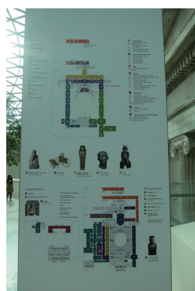
圖8 觀眾可跟著指標找TOP 10展品

鎮館之寶。觀眾按圖索驥即可找到TOP 10展品，同時出現在公共空間的指標系統，也讓觀眾免於迷路，能更快速的找到展品(圖8、9)。博物館商店也以這10件展品設計出各式各樣的紀念品，完成觀眾最後的博物館參觀體驗旅程。從超過6萬件的展出藏品中聚焦到必看的10件藏品，這種聚焦再聚