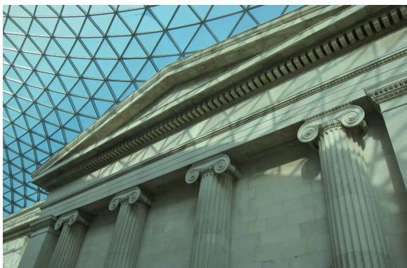
圖2 希臘愛奧尼列柱