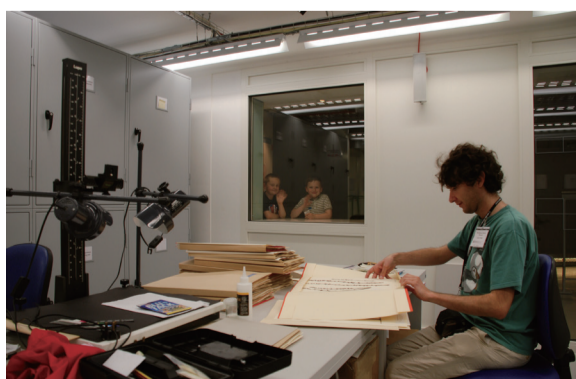
圖4-5 在倫敦的自然史博物館植物標本館，對外開了一扇窗，當研究人員在研究比對標本時，可能就是表演者，隨時有觀眾在外駐足觀看。

植物標本館具有繼往開來的使命及普及自然科學教育的功能，是值得做為任何一座自然史博物館下一個十年的任務。自然科學教育不只是看花草草或模型影像而已，也必須讓民眾知道標本館的重要性，如此才能培養新一代的科學家，而且是真正瞭解自然史的科學家。