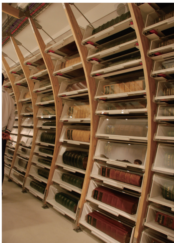
圖1 早期的植物標本就像「書籍」一樣，一本一本排列架上，而標本館就像圖書館。

目前最古老的植物標本館在義大利(辛尼所創)，而現今蒐藏量最豐富的植物標本館則是英國倫敦的皇家邱植物園(Royal Botanic Gardens, Kew; 國際標本館代號K)、法國巴黎自然史博物館(Laboratoire de Phanerogamie, Museum National d'Histoire Naturelle; 國際標本館代號P)及俄羅斯