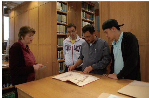
圖3 牛津大學是英國首座植物標本館，研究人員正在說明該館的一些極古老的標本。

狀，標本數量成長緩慢，不太交換標本也沒人採集；或是將標本捐給上述其他三種單位。然標本館的活化，在植物園及博物館中是近十年來重要的課題。英國倫敦自然史博物館(Natural History Museum; 國際標本館代號BM)在2009年時將植物標本館(還包括昆蟲標本館、分子實驗室)都「開窗戶」(圖4、5)，可以讓觀眾看到研究人員在標本館內做些什麼，每週更開放民眾預約(每週2、3次，一次約20人)，由專人帶進標本館解說標本製作、標本記錄、標本的意義、為何要採集標本等等，讓此「沈寂」且「神秘」的標本館，可以與民眾接近，讓大家知道國家為什麼要花錢來維持標本館的存在。若沒有研究人員在標本館或沒預約上現場參觀時，則是由投影機將上述資訊打在標本桌上，民眾可以隔著「玻璃窗」看到標本的資訊(圖6)。或許先有概念，下次就會去預約參觀現場了。皇家邱植物園更用一張大海報告知參觀民眾，一份臘葉標本，可能衍生有關形態學的研究、解剖學研究、花粉學研究、遺傳學研究、分子生物學研究、園藝學研究等。一份標本保留著生物最基本的資料(若有活體，可能種在植物園，但若該株植物死亡，至少有本份標本，可做為其研究成果的證據)！