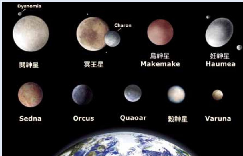
圖2. 目前已經發現的太陽系中型天體,5個有中文名稱的已經正式歸類為矮行星,其他還在審查中。

在1940-50年代有幾位彗星研究學者在研究週期小於200年的短週期彗星時,發現它們的軌道方向和9大行星的方向一樣,軌道平面和地球繞行太陽的黃道面夾角雖然比行星大,但是並不會差太多,遠日點則在30~50個天文單位(astronomical unit, 簡稱AU,是地球到太陽的平均距離,約1.5億公里)。他們懷疑這個地方是太陽系演化形成的雲氣盤面的外緣。因為越外緣演化速度越慢,所以當核心形成恆星太陽、周圍形成大行星時,這個地方的物質只來得及由小