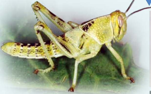
圖1. 蝗蟲為不完全變態類昆蟲