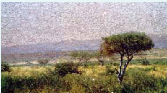
圖2. 昆蟲的數目驚人，圖為蝗蟲過境時引發蝗災之情景。

早在35億年前地球上就已出現生命現象，近12億年前的今天出現多細胞生物，昆蟲自古生代(Palcozail)之泥盆紀(Devonian)登陸地球以來，至今已有近3億5千萬年的歷史。地球環境之改變可以說是千變萬化，可是昆蟲卻都能很好地適應地球環境之變遷。地球上的每一個角落幾乎都有昆蟲的蹤影，不但如此，目前昆蟲的種類已達一百多萬種，占整個動物種類的四分之三以上。在此意義上來說，我們所居住的地球原來是昆蟲的星球，一點也不為過(圖1、2)。那麼，我們不禁要問，昆蟲為何能成功立足於地球，適應地球環境之變遷呢？科學家們一般認為，昆蟲通過蛻皮與變態來完成整個生命週期是其成功適應地球環境變遷的重要方式之一，經由幾丁質成份極高的外表皮包裹整個身體，使其能適應陸地的生活，防止體內水份的蒸發，同時，使其生長產生非連續性——即有蛻皮過程的發生，而變態過程的產生使昆蟲在幼蟲期專注於取食與生長，在成蟲期則擔負起繁殖後代的重任。幼蟲之食物的攝取促進了體內組織細胞的生長，當其生長量達到某一程度時，幼蟲就必須更換新的更大的表皮，以滿足體內組織細胞進一步生長的需求(圖3)，這就形成了蛻皮的過程，當幼蟲經過多次蛻皮後，必須進行體內組織器官的改組，進行變態(圖4)，以形成成蟲的組織器官。變態的過程短暫