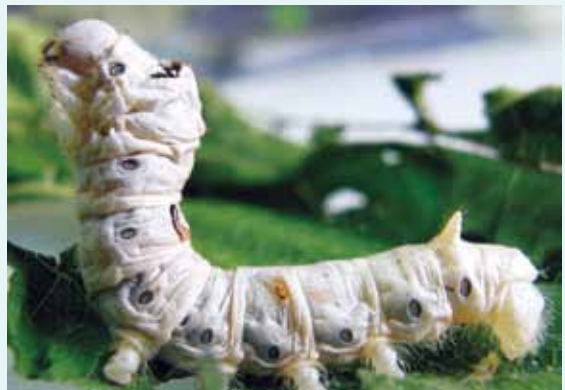
圖3. 剛蛻皮的家蠶之5齡幼蟲表皮寬鬆，可容許體內組織的不斷生長。