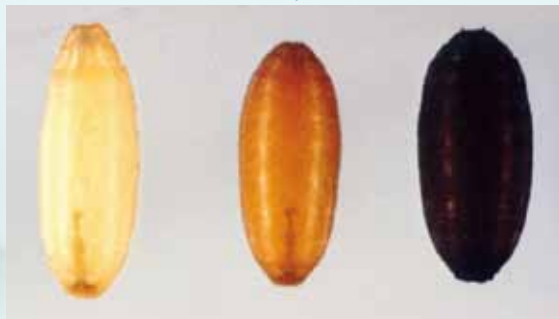
圖4. 蛹期為完全變態類昆蟲從幼蟲到成蟲的過渡期，圖為蒼蠅之蛹。