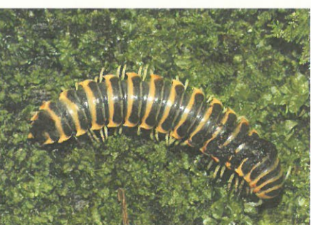
圖5.溪頭森林中常見的大型光帶馬陸，背面有亮眼的黃色條紋。