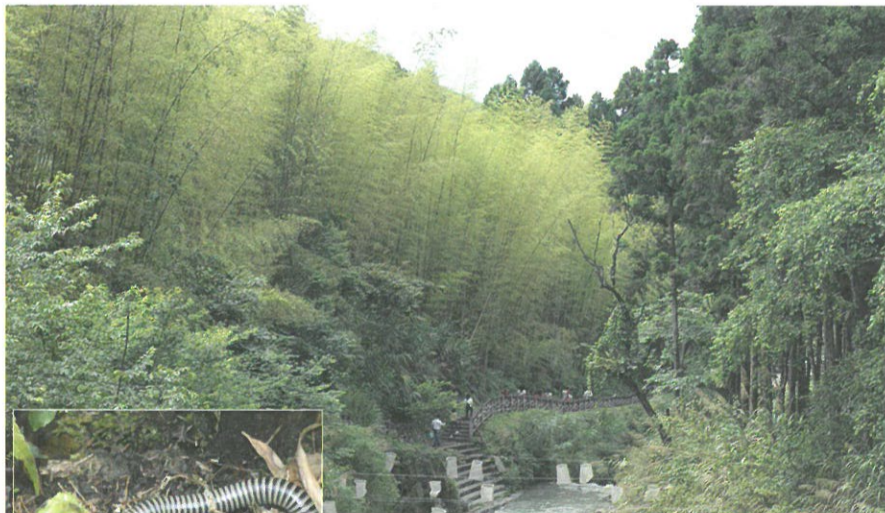
圖8-1.中台灣溪頭地區四處可見的竹林落葉堆中，就棲息著數量不少的大型馬陸。