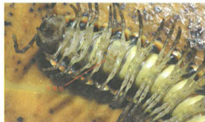
圖2.光帶馬陸 Riulciliaria holstii 的腹面觀，每個體節有兩對腳，雄蟲第七體節的第一對腳（或兩對腳）變形為「生殖肢」。

由於某些馬陸的外型乍看之下與蜈蚣略似，因此許多人對馬陸相當戒慎恐懼，往往一見到就趕緊將牠們打死；其實，絕大部分的馬陸都是以腐植質為食物，攝食新鮮或變乾的落葉，將落葉轉化為其他分解者可利用的腐植土，並不會直接蠶食活的葉片，所以不僅對絕大多數的農業及植栽無害，而且是最初級的分解者，應該是益蟲。牠們對人類最大的威脅，是其賴以保命的防禦系統——身體兩側有小孔可以分泌刺激性的液體，用來趕走侵犯的敵人；這些防禦性的分泌物含有醛類、酚類、苯酚，或是含有氰化物。我們踩及馬陸時，有時會聞到一些特殊的氣味，