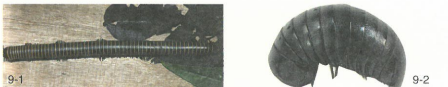
圖9.馬陸的外型及體節數目，隨種類不同而有極大的差異： 9-1 旋刺馬陸（山蝨） Spirobolus sp. 體型較為細長，體節可達60節左右。 9-2 節球馬陸 Sphaerotheriida 體型短胖，僅有10個體節。