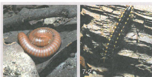
圖7.落葉堆、石塊下、樹皮內、枯木下、圓木堆或草堆下都可發現馬陸的蹤跡。