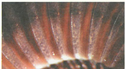
圖3.磚紅厚甲馬陸 Trigoniulus corallinus 體側防禦用的「驅拒腺」開口小孔