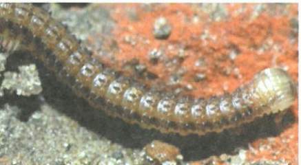
圖4.顆粒雕背馬陸 Glyphiulus granulatus 背面有數列明顯的突起顆粒