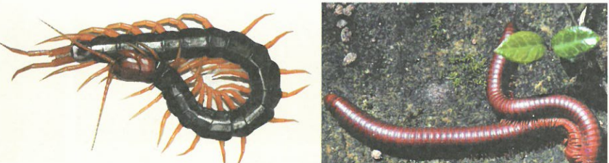
圖10.巨蜈蚣雖然每個體節僅有一對腳，但行動反而十分迅速，善於追捕獵物。 圖11.交配中的磚紅厚甲馬陸，腹面相對。