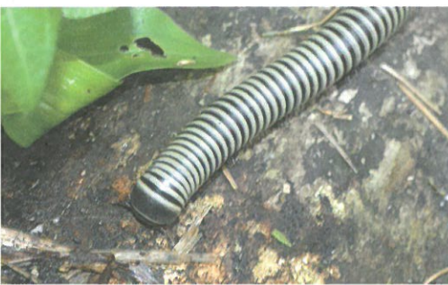
圖1.產於台灣中部竹林間的超大型旋刺馬陸(山蝨) Spirobolus sp.，具有醒目的黑白相間條紋。

就是這些分泌物的味道。這些防禦用的腺體稱為「驅拒腺」，通常開口在體節背板兩邊的側緣（圖3）。