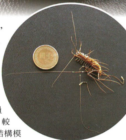
圖2.「怪蟲」蚰蜒的大小比例