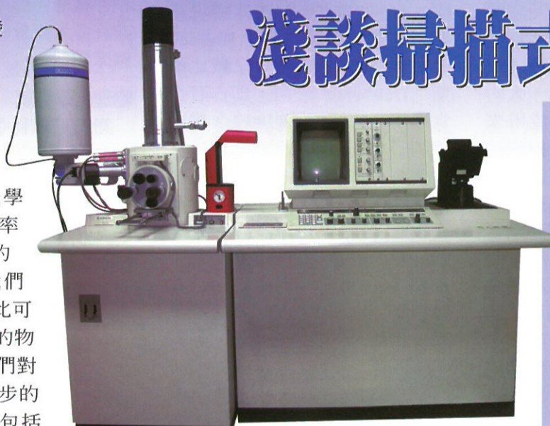
圖1.掃描式電子顯微鏡

SEM) 的理論與構想，並於1938年由Von Ardenne發明製造成功，之後經過不斷的研究、改進及大力推展，直到1965年才將之商品化正式發售。