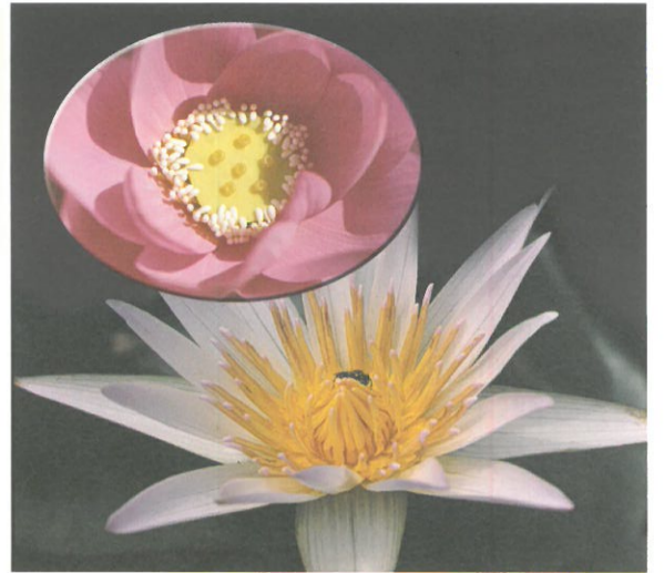
圖5. 荷花中心已經可以見到果實蓮蓬(上)，睡蓮則否。

植於池塘的蓮大多生長旺健，對一般的病蟲害都有一定的抗力。盆栽的荷花大多較為嬌弱，也容易困於病蟲害；因此，必須多留意，一