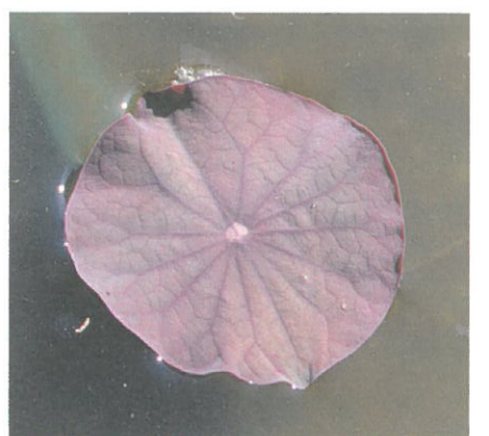
圖9. 蓮苗初期的荷葉呈紅色，浮水型。