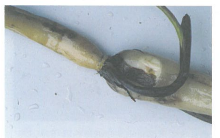
圖8. 種藕，取自蓮藕前段，應該具有完好的芽，細瘦而不若食用藕般肥壯。