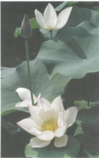
圖1. 脫俗的蓮，盛綻秀麗的荷花。