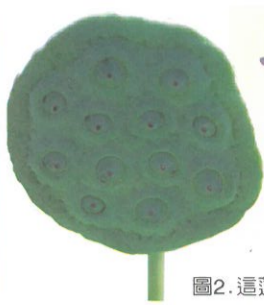
圖2. 這蓮蓬，正是蓮子的家。