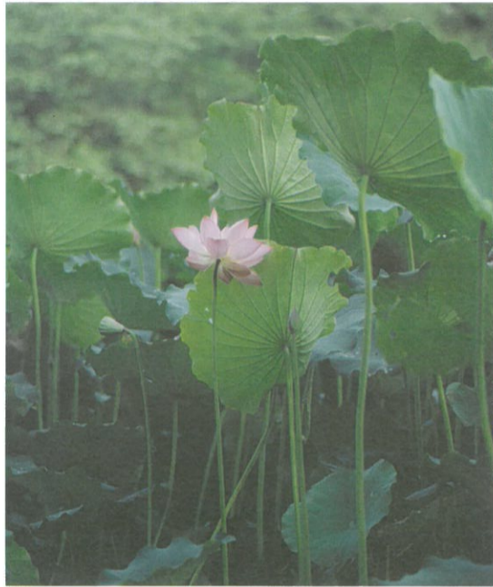
圖3. 蓮的花叫做荷花，是大型的挺水植物。