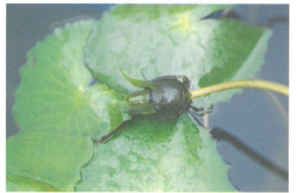
圖6. 這才是睡蓮的果實。

有蟲害，便應該立即人工捕捉；若情況嚴重且藥物控制不彰，則不妨強剪除地上部，令其自然更新重長。