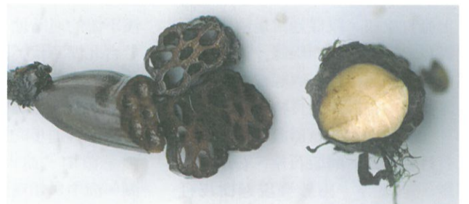
圖7. 蓮的地下莖稱蓮藕，有節，內部中空；睡蓮的地下莖(右)如馬鈴薯狀，無節，實心。

舊有的盆栽，每年清明前後就應該進行翻盆，將盆器內的土壤倒出，呈現土內的新藕，再進行種藕的選取與重新栽種。秉持上述的原則，則這一季的夏，又可以擁得荷香飲夜色了。