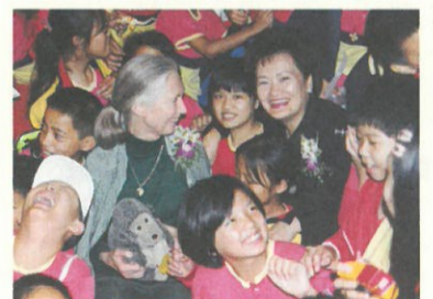
圖2. 熱情的觀眾爭先恐後與珍·古德博士及台中市張溫鵬市長合影。

件是一位921地震埔里災區小朋友的贈物——一塊很像台灣的殘破水泥塊，上面還寫著他們對地震的感覺及未來的願景，它代表對地球環境的信心。