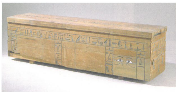
圖2. Tschettuj 的木棺，陰刻文。中王國時期，第11/12王朝，約公元前2000年。