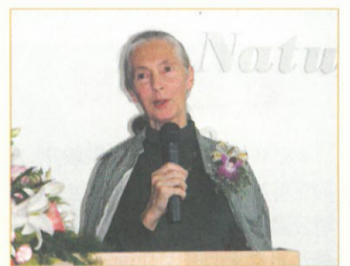
圖1. 「珍愛自然—國際生態攝影展」開幕記者會中邀請到珍·古德博士致詞。

演說中她提到曾有朋友問她：「現今地球環境已遭受到如此的破壞，是否還有希望呢？」她則微笑著回答：「還有希望！」原因是人是有智慧的、大自然存有無限的生機、人的毅力無窮且她對年輕人很有信心。她在世界各地提倡成立的根與芽社團，主要做對人、對動物、對環境有益的事，可由這些社團的成員及推行的工作中肯定人類是有希望的。最後珍·古德博士依例展現來自各地友人的饋贈紀念物，並與大家分享它們特殊的意涵，第一件是來自一位雙目失明卻能愉快樂觀、自立自強發展潛能的朋友所送的灰色猴子，它已被各國朋友撫摸，以希望學習原主人的毅力，它代表著對人的信心；第二件是台灣復育成功的梅花鹿在冬天掉落的鹿角，它代表對野生動物的愛；第三