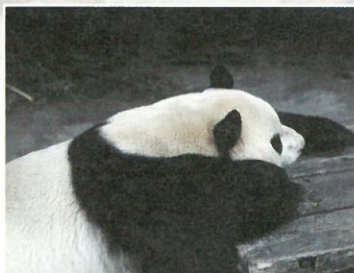
圖5.趴睡在桌上的大熊貓