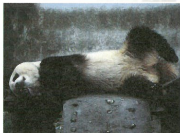
圖4.躺著睡的大熊貓