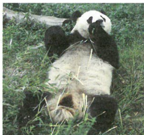
圖3.躺著吃竹子的大熊貓