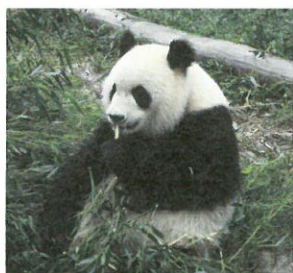
圖2.坐著吃竹子的大熊貓