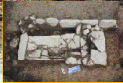
圖2.埔里基督教醫院大馬璘遺址出土第4號石板棺墓葬

塊棺板。第2號墓保存完整，棺內長65cm，寬21cm，高10cm，沒有遺留人骨或陪葬品，由石板棺的大小判斷，當初埋葬的可能是一名幼兒。