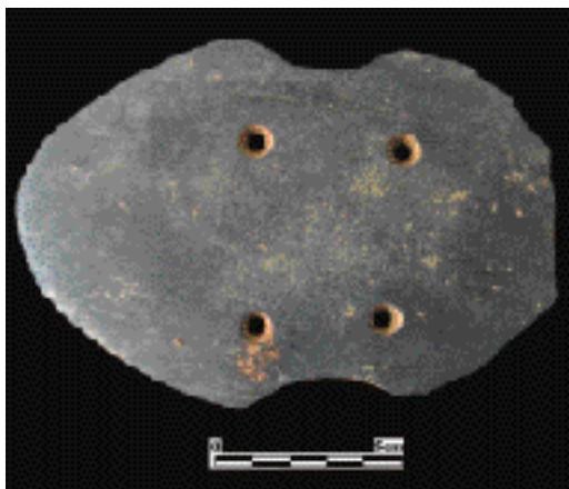
圖5.大馬璘遺址出土磨製石鏟