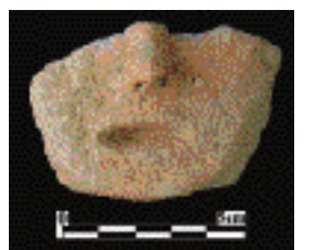
圖8.埔里盆地塑人面殘片

具；石鏟、砥石、石鋸、打製石片器及鑽頭等，都是製造石器的工具。玉質裝飾品包括耳飾玦、手環、管珠、鈕扣形玉飾及玉墜飾等。此外，還有許多帶有加工痕跡的玉料、石材或板岩片，是製造玉、石器過程中產生的廢料。