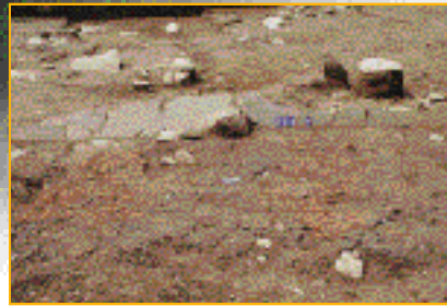
圖3.台灣地區首次發現人工火燒地面

結構、平鋪板岩結構及火烤地面。石列結構一般是由大小不等的礫石構成，以單行排列，3、4層堆疊而成。立板結構是由幾塊豎立的板岩石板，連續排列而成。火烤地面是一片以火燒烤過的硬土地面，表面是橙紅色與灰黑色交雜出現，外觀呈長條形，寬約12cm，平均厚度約6cm，走向與建築結構的長軸方向相同（圖3）。