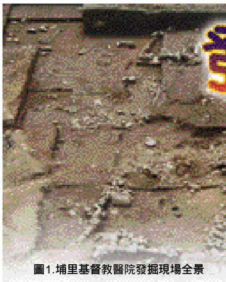
圖1.埔里基督教醫院發掘現場全景