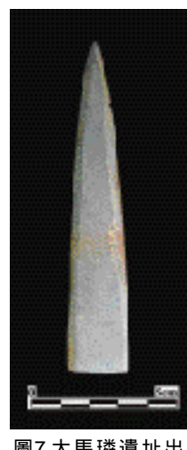
圖7.大馬璘遺址出土箭頭