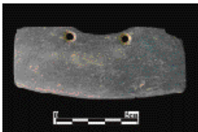
圖4.大馬璘遺址出土馬鞍形石刀

本次發掘共出土4具墓葬，是以板岩石板拼湊而成的長方形石板棺；長軸走向都在西偏北10°至20°之間，與以往各次發掘出土的石板棺方向相同（圖1）。第1號墓可能在1962年前後因為施工而被破壞，出土時只殘餘三