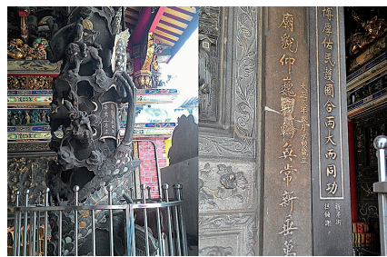
圖5 嘉義縣新港鄉奉天宮於1906年梅山地震後重建的龍柱、石雕。

當臺灣西部發生規模大於7的地震, 總會造成嚴重的損傷。1848年彰化地震、1862年臺南地震與1906年梅山地震都是距今超過百年以上的大地震, 死亡人數皆超過千人。這些地震很容易因年代久遠而被忽略, 但它們其實是臺灣地震史的重要教材, 可以讓後人以古鑑今, 瞭解地震的重要性。這些歷史地震顯示地震斷層發生在鄰近人口密集的区域必然造成重大損失, 本文期望藉由回顧歷史地震喚醒人民對地震的認識, 儘量避免居住在鄰近活動斷層周圍的区域, 加強對地震災害的瞭解, 等到下一次地震來臨時, 才能減少人員傷亡與災害。