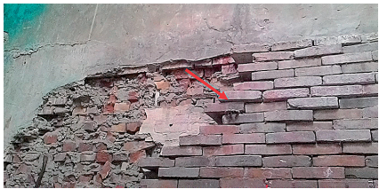
圖2 位於嘉義縣新港鄉新民路上, 1906年梅山地震所保留下來的清朝磚造牆壁(箭頭處)。

回顧臺灣百年來的歷史地震, 最嚴重的傷亡主要發生於臺灣西部地區。而嘉南地區近百年來最嚴重的歷史地震, 發生於1906年3月17日的梅山地震, 震央位於現今的嘉義縣民雄鄉與梅山鄉附近(圖1), 芮氏規模7.1, 在臺灣西部百年地震史中, 屬於高於規模7的強震。這次地震災情慘重、死傷眾多, 死亡人數高達1,258人, 在臺灣近百年來的地震災害中, 死亡人數位居第三。本文藉由地震史料, 回顧地震對當時臺灣社會的衝擊與影響。