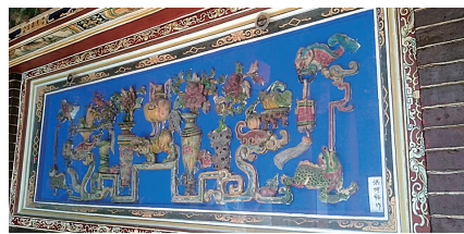
圖7 嘉義縣新港鄉奉天宮收藏的洪坤福的交趾陶作品