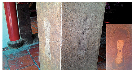
圖6 嘉義縣新港鄉奉天宮後殿因1906年梅山地震受損裂開, 後由重建師傅打釘穩固(右下圖為柱後打釘圖)。