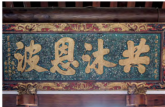
圖6 震興宮於同治己巳年完工時匾額