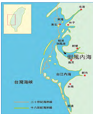
圖1 臺灣西南部瀉湖海岸數百年海岸變遷圖。左圖為現今海岸線與18世紀海岸線比較；右圖為現今海岸線及兩次海侵古海岸線分布圖（引用自張瑞津和陳翰霖，2001；陳岫傑，2002；沈淑敏，2011）。