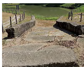
圖3 「麻豆古港」碼頭遺址