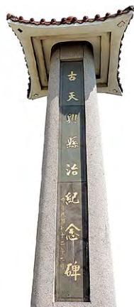
圖2 位在佳里震興宮前的古天興縣治紀念碑

倒風內海的麻豆（現稱麻豆）古港，當時佔地利之便，船隻可直達福建，為麻豆的發跡地。明末清初時期漢人渡海移民臺灣，大多群居在港口及海岸區域，而這些港口往往形成街市，麻豆街舊址應是漢人遷入麻豆的最初居住處。來此參觀麻豆