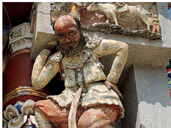
圖7 佳里震興宮入口處的廊廡上方之「魁番秀廟角」，為葉王的作品。