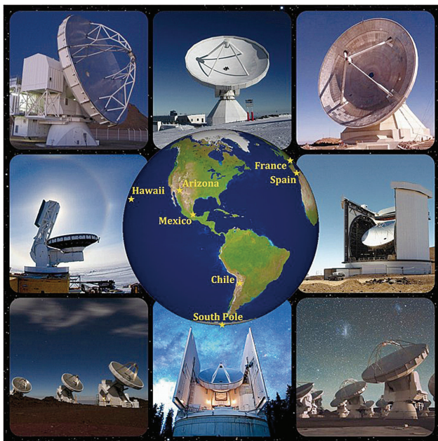
圖4 EHT望遠鏡陣列分布世界各地