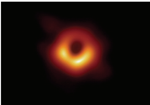
圖3 M87星系(位於室女座)中央的黑洞，這是人類史上第一個捕捉到的黑洞影像。