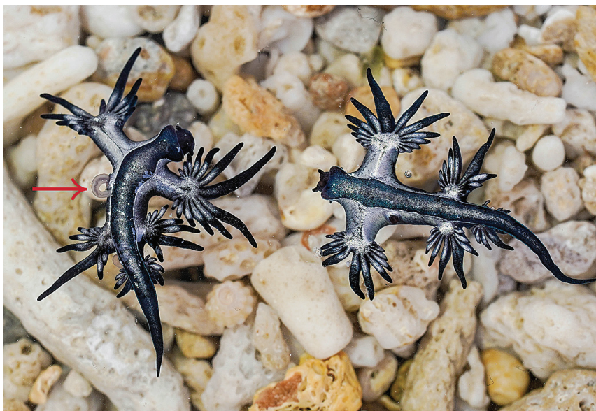
圖5 一對準備交配的大西洋海神海蛞蝓，圖中左邊那隻的軟管狀生殖器已經伸出(箭頭指處)

吃進體內的刺絲胞，被原封不動地轉移到露鰓表面。水螅水母用來防禦獵殺的彈藥，被海神海蛞蝓巧奪成為貼身肉搏時的最後防線。