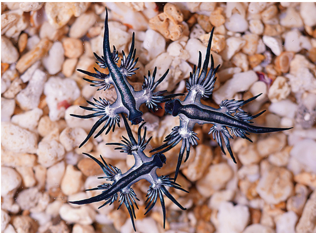
圖1 海神海蛞蝓是極少數終身行漂浮生活的海蛞蝓。圖為此文主角一大西洋海神海蛞蝓 Glaucus atlanticus 。

只不過大海茫茫，要在風與海流配合得剛剛好的情況下，先把一群漂流的水螅水母在漲潮時分推送上岸。而且這種肉眼勉強可辨、僅發現藏身在一群讓人避之唯恐不及的有毒生物中的海神海蛞蝓，過去被發現的紀錄比中樂透還低。大西洋海神海蛞蝓首次在臺灣的觀察記錄，是2012年在屏東小琉球；第二次是在基隆的八斗子。這兩次都只觀察到1隻。2017年在墾丁合界則出現隨著錢