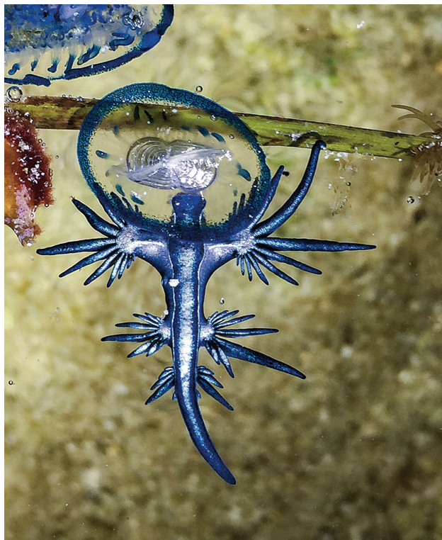
圖4 鑽入風帆水母浮囊下大快朵頤的大西洋海神海蛞蝓