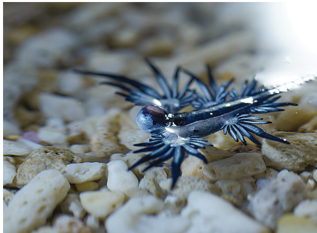
圖3 漂浮在水線上的大西洋海神海蛞蝓

顯然地，水螅水母刺絲胞的劇毒對海神海蛞蝓起不了作用。尤有甚者，隨著水螅組織被海蛞蝓