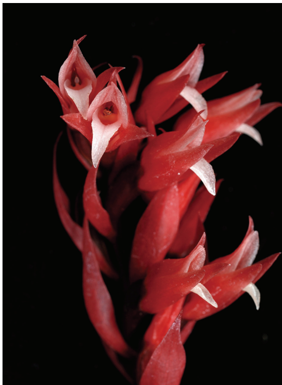
圖2 美花綬草( Stenorrhynchos speciosum )鮮紅色的花朵

的斑葉蘭亞族(subtribe Goodyerinae)成員。另外，與斑葉蘭亞族親緣關係較接近的綬草亞族(subtribe Spiranthinae)亦有些原生種葉片具有斑紋，花朵與葉斑紋都相當美麗，例如原產於中南美洲的美花綬草( Stenorrhynchos speciosum )，其花序的苞片與花被片均呈赤紅色(圖2)。綬草又稱之為清明草( Spiranthes sinensis )，在臺灣為常見的野生蘭花，可見於公園綠地、田埂、草坪等開闊的草生環