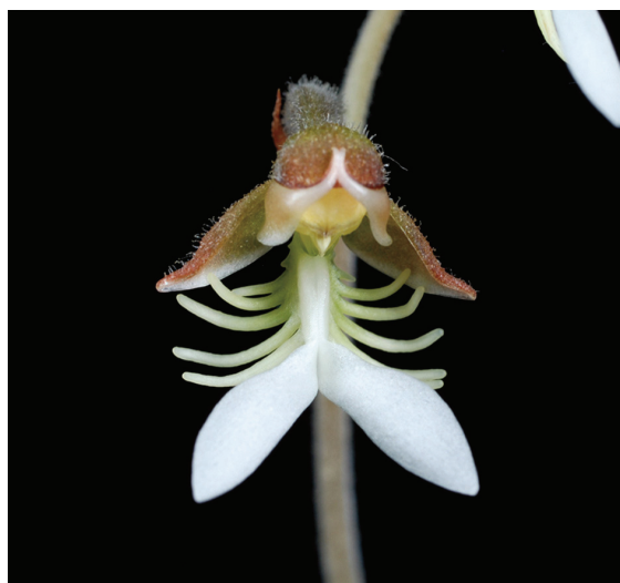
圖4 臺灣金線連( Anoectochilus formosanus )的花朵

斑葉蘭屬( Goodyera )包含100多個原生種，分布於歐亞洲大陸、美洲、澳洲、印度洋小島以及太平洋小島。臺灣有約20種斑葉蘭，常見於中高海拔山區，有些葉片翠綠具有美麗的格紋，例如花格斑葉蘭( Goodyera kwangtungensis )、大武斑葉蘭( Goodyera daibuzanensis ) (圖5)。而鳥嘴蓮( Goodyera similis )暗紫色的葉片具有明顯的白色中肋條紋。此外，還有假金線連( Goodyera hachijoensis