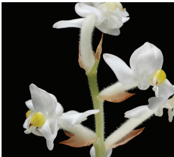
圖3. 血葉蘭( Ludisia discolor )的花朵

境，其葉片通常為單一綠色。在日本的山野草協會，趣味栽培者經過長年的選拔，將一些斑葉(variegated leaf)且矮生的綬草突變株繁殖培育，成為可賞花亦可觀葉的品種。市面上還有一些葉片美麗的蘭花原生種，例如美葉沼蘭( Malaxis calophylla )，它不屬於蘭亞科(subfamily Orchidoideae)，而是樹蘭亞科(subfamily Epidendroideae)沼蘭族(tribe Malaxideae)的成員。