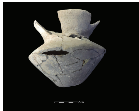
圖3 灰坑中出土的較完整陶罐