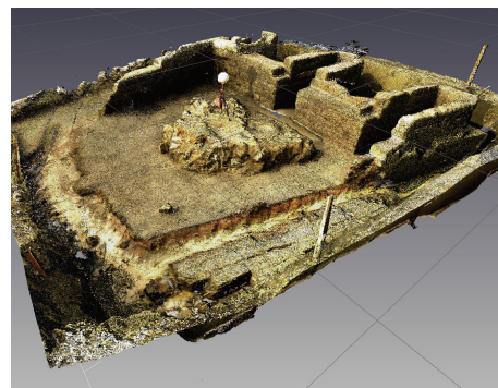
圖5 考古結構物的3D模型